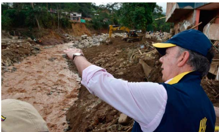
現地を視察するサントス大統領 2017.4.2 (大統領ウェブサイト)

出典 : https://www.facebook.com/pg/MindefensaColombia/photos/