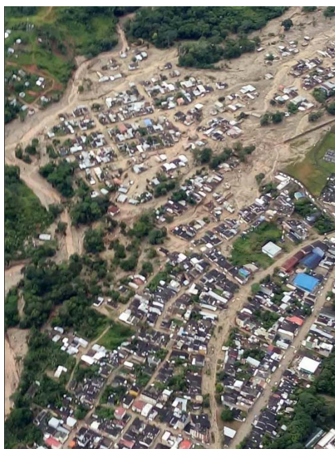
2017.4.1 (コロンビア国防省)