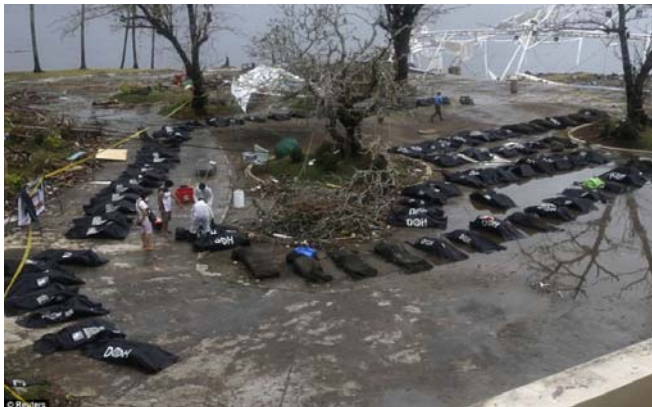
Clean up: Police and military personnel are removing bodies from the streets of Tacloban as they try to restore order