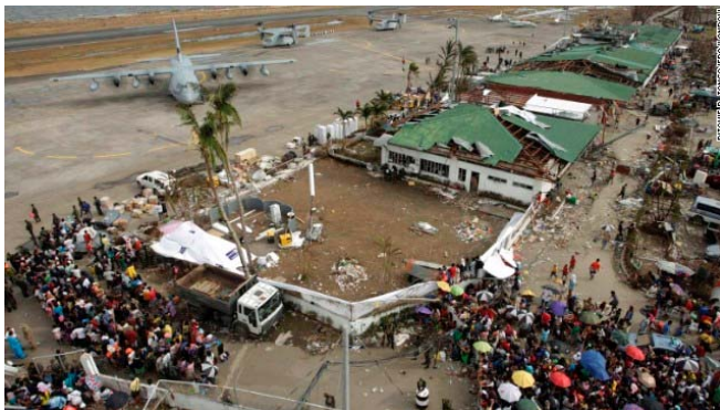
Stranded passengers board a plane at a damaged airport in Tacloban, Philippines, on Wednesday, November 13. Troops and aid organizations have been confronted with blocked roads and devastating damage while trying to deliver aid to Filipinos struggling to survive in the aftermath of Super Typhoon Haiyan, one of the strongest storms in history.