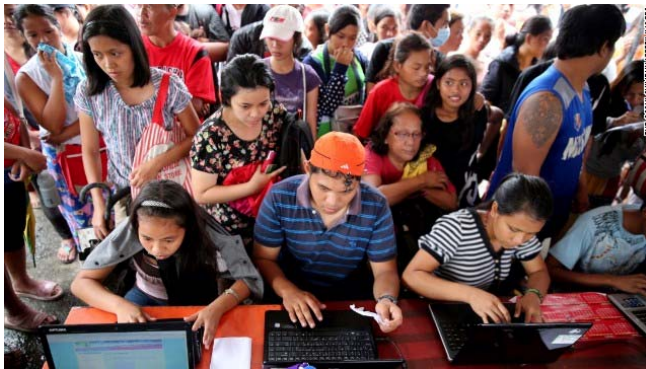
Evacuees send e-mails to their family members and relatives at a free Internet cafe set up by the Philippines government on November 12 in Tacloban