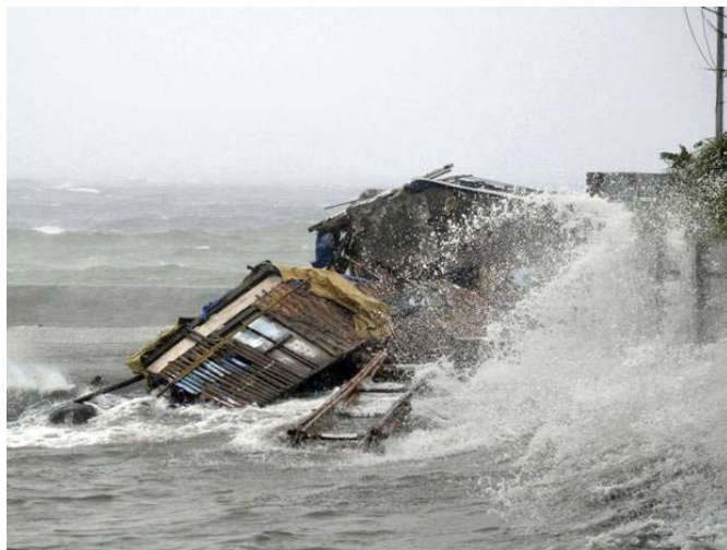
TYPHOON HAIYAN: EXPERTS FLY IN TO PHILIPPINES AS DEATH TOLL REACHES 1,200