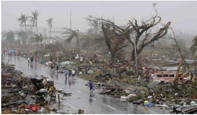
Destruction from Typhoon Haiyan in Tacloban city, Leyte province, central Philippines