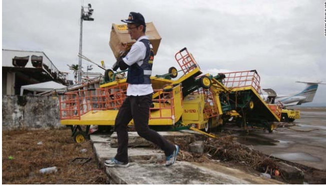
A member of the Japanese Disaster Relief Team carries goods in Tacloban on November 12.