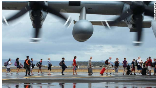
People board a U.S. military plane to evacuate Tacloban on November 12.