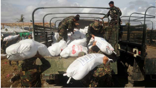
Soldiers load relief goods onto a truck in Tacloban on November 13.