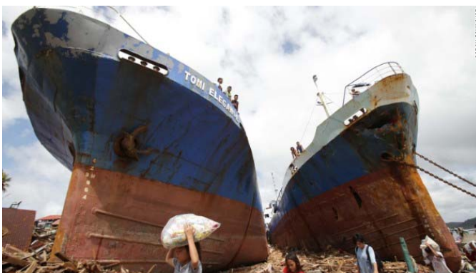
Survivors pass by two large boats after they were washed ashore by strong waves caused by Typhoon Haiyan in Tacloban city, Leyte province.