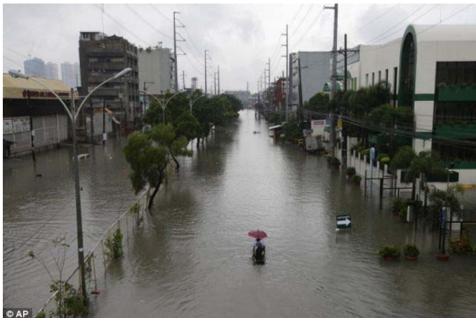
Residents use a small boat for transport through a flooded street at suburban Quezon city, northeast of Manila