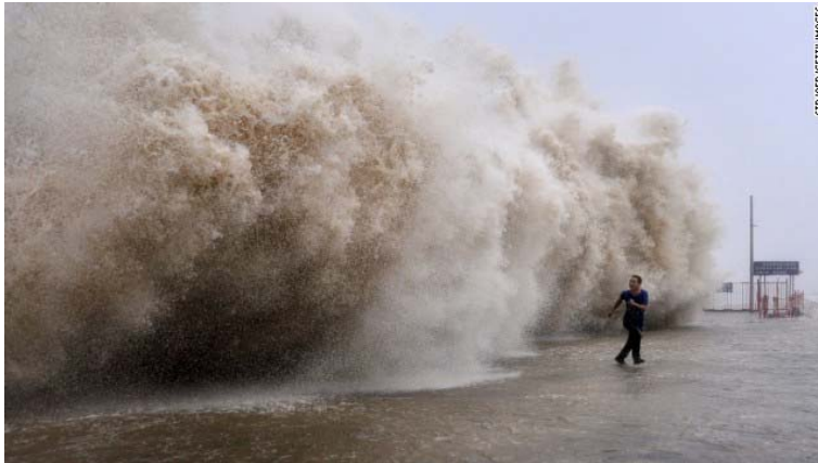
A man runs from a huge wave on a wharf in Shantou, China, on Sunday, September 22.