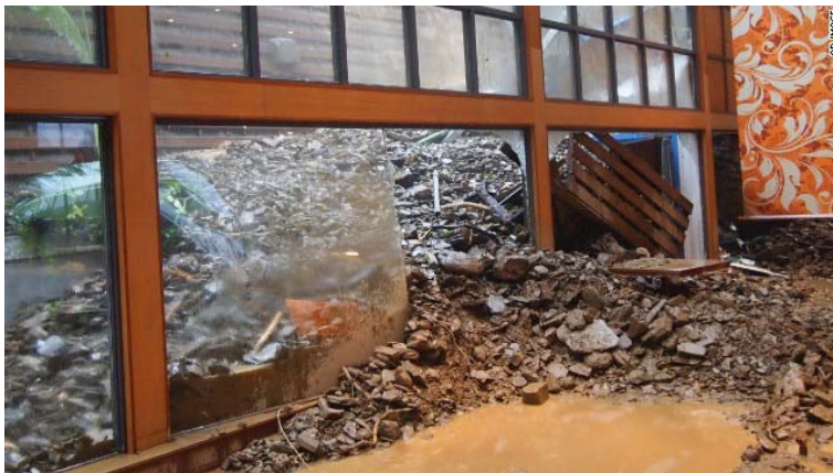
Typhoon Usagi's torrential rains caused landslides at a southern Taiwanese resort, sending mud and rocks crashing through the windows late Saturday, September 21.