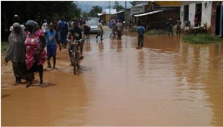
Buterere is one of the worst affected districts of Bujumbura