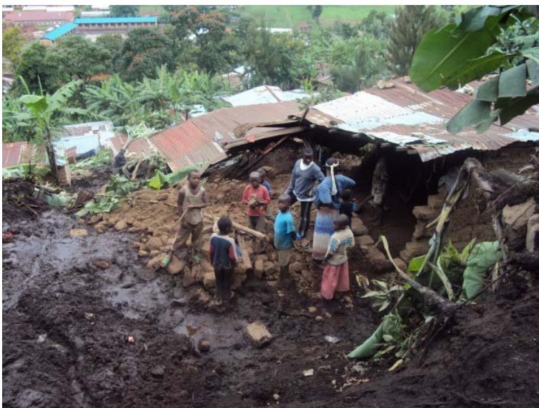
A night of torrential rain in the Burundi capital killed at least 51 people, swept away hundreds of homes and cut off roads and power, officials said Monday.