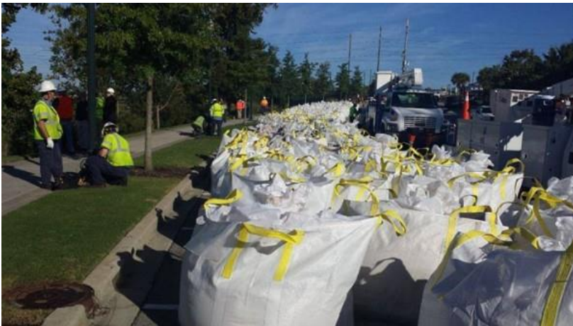
Columbia Canal breach. City U&E, SCE&G & National Guard are working to stabilize the Canal breach.