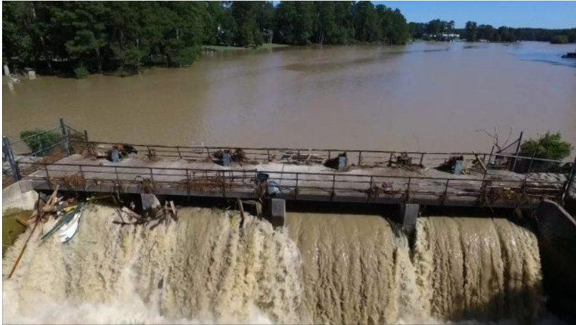
CNN drone picture of flooding damage in Columbia, South Carolina on October 6, 2015