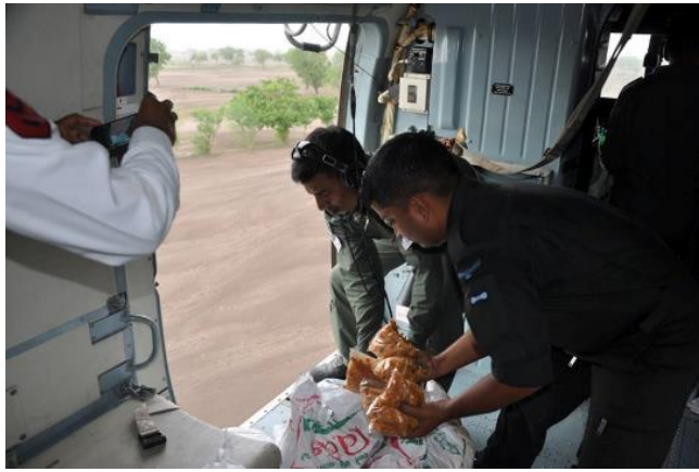
Ministry of Defense, Government of India

Relief operations were carried out by the Indian Air Force in flood affected areas of Gujarat today by deploying 6 MI-17 V5 Helicopters.