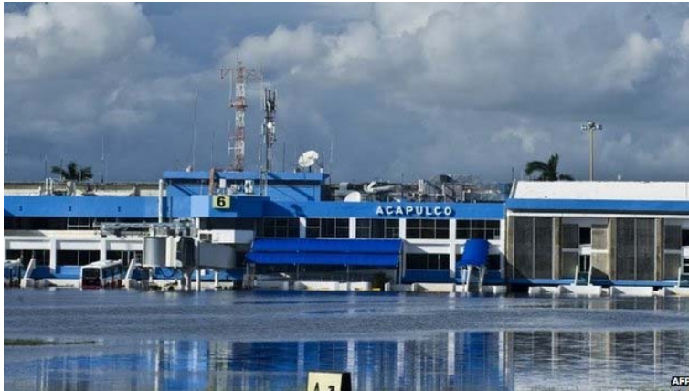
Floodwaters prevented passengers from using the airport's terminal at Acapulco international airport