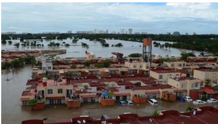
People stand on the rooftop of a home in a flooded neighborhood after Tropical Storm Manuel pounded Acapulco, Mexico, Tuesday, Sept. 17, 2013.