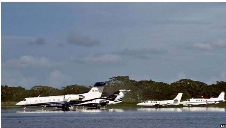
Aircraft sit on the flooded tarmac at the airport of Acapulco