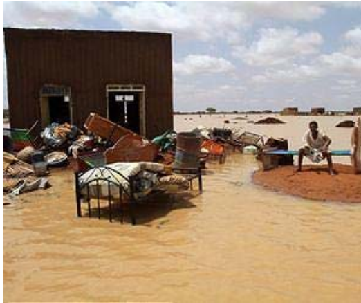
A Sudanese man sits next to his house in a flooded street on the outskirts of the capital Khartoum on August 10, 2013. Drainage is poor in the capital, where even a little rain can cause flooding but this year's water surge was unusually severe.